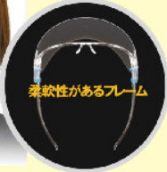
柔軟性があるフレーム

フレーム:ポリカーボネート・熱可塑性エラストマー シールド:PET(曇り止め加工) シールドサイズ:252×0.25×195