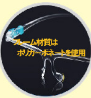
フレーム材質はポリカーボネートを使用